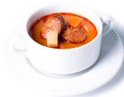
Magyaros burgonyaleves libakolbással