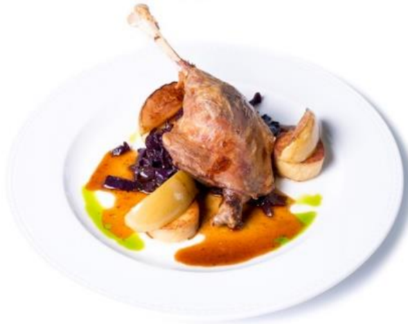
Ropogós kacsacomb párolt káposztával, burgonyagombóccal