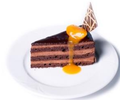
Sacher torta sárgabarackkal