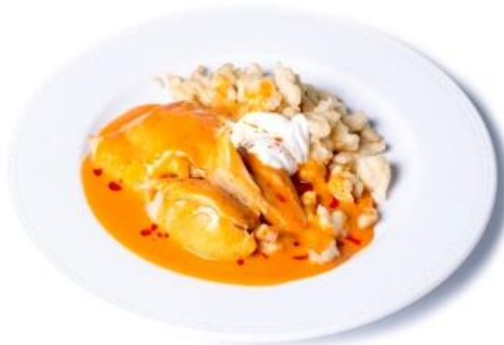
Paprikás csirkecomb filé galuskával