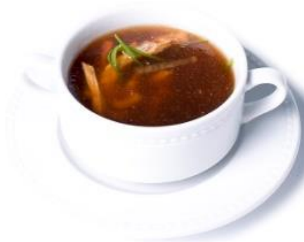
Marhahúsleves roppanós zöldségekkel