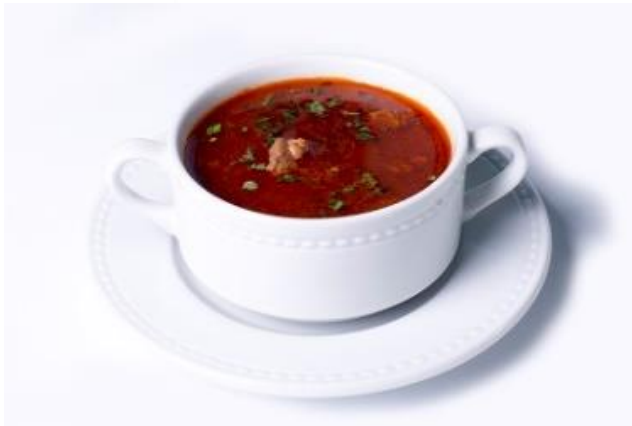
Tradicionális marhagulyás, kívánság szerint erős paprikával