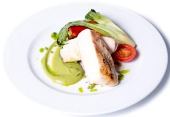
Grillezett csirkemell filé sült zöldségekkel