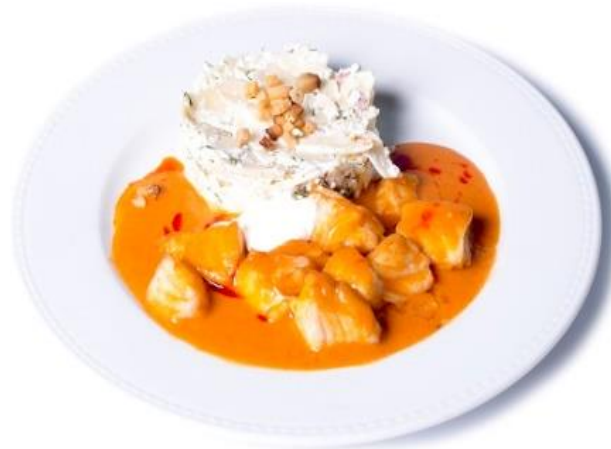
Harcsaparikás formázott túrós csuszával