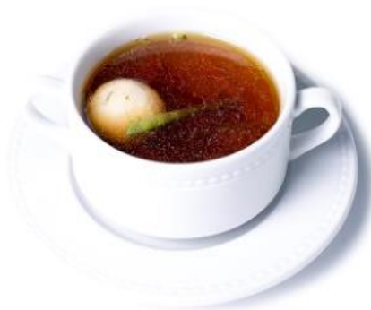
Tyúkhúsleves benne főtt zöldségekkel, cérnametéllel