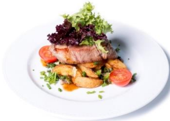
Grillezett tarjasteak héjában sült újhagymás burgonyával