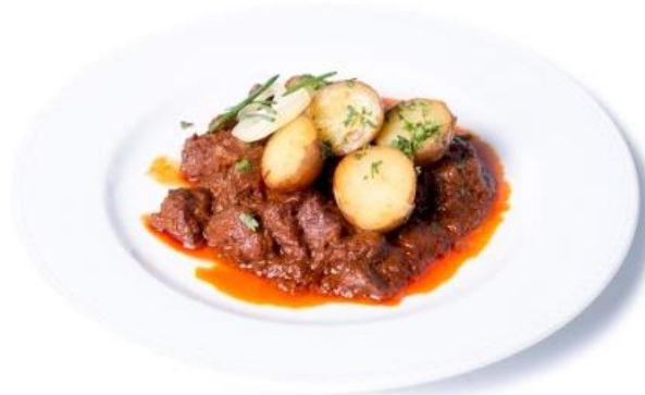
Vörösboros marhapörkölt petrezselymes parászburgonyával