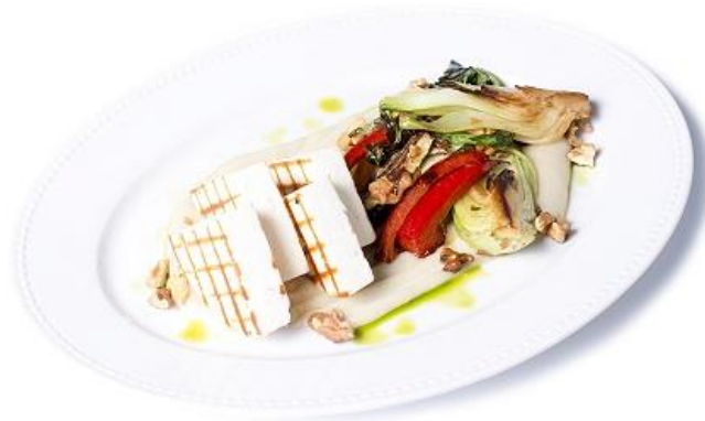
Grillezett juhsajt, sült zöldségekkel